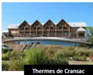
Thermes de Cransac